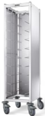
TAW 10 GN mit 3-seitiger Verkleidung, Edelstahl