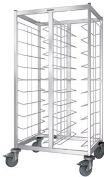
TAW 2 x 10