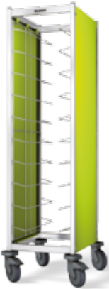
TAW 10 GN mit 2-seitiger Verkleidung, Farbe: limette