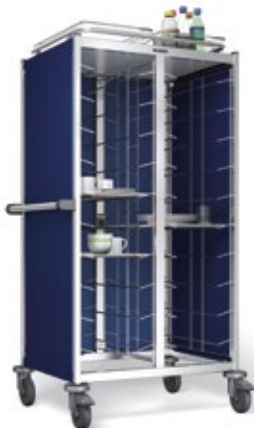
TAW 2 x 10 GN mit Wagendach in Edelstahl mit umlaufender Galerie und Schiebegriff (Abb. mit Zubehör)