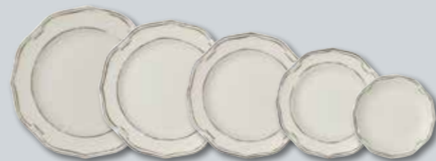
OCR-Nr. 16-4059-2600 Ø 290 mm · 11 ¼ in. Flat plate · Assiette plate · Teller flach Plato llano · Piatto piano