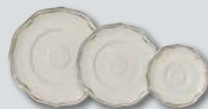
OCR-Nr. 16-4059-1250 Ø 190 mm · 7 ½ in. Saucer · Soucoupe · Untere · Plato para taza Piatino tazza (Cup, Tasse, Tasse, Taza, Tazza OCR-Nr. -1240, -2510, -2513) OCR-Nr. 16-4059-1280 Ø 160 mm · 6 ¼ in. (Cup, Tasse, Tasse, Taza, Tazza OCR-Nr. -1270, -1710, -2510) OCR-Nr. 16-4059-1460 Ø 120 mm · 4 ¾ in. (Cup, Tasse, Tasse, Taza, Tazza OCR-Nr. -1450)