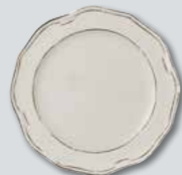
OCR-Nr. 16-4059-2800 Ø 320 mm · 12 ½ in. Round platter · Plat rond · Platte rund Fuente redonda · Piatto grande rotondo