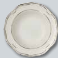
OCR-Nr. 16-4059-2700 Ø 240 mm · 9 ½ in. Deep plate · Assiette creuse · Teller tief Plato hondo · Piatto fondo