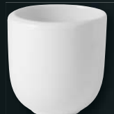
OCR-Nr. 10-4264-9660 Ø 90 mm, H = 95 mm · 0,4 l Ø 3 ½ in., H = 3 ¾ in. · 13 ½ ozs. Mug without handle · Chope sans anse Becher ohne Henkel · Jarra sin asas Bicchiere senza manico