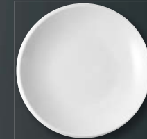
OCR-Nr. 10-4264-2701 Ø 250 mm, H = 40 mm · 0,90 l Ø 10 in., H = 1 ½ in. · 30 ½ ozs. Bowl flat · Coupe plate · Schale flach Fuente llana · Coppa piana