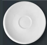
OCR-Nr. 10-4264-1310 Ø 170 mm, H = 20 mm Ø 6 ⅝ in., H = ¾ in. Saucer coffee cup · Soucoupe tasse à café Kaffeuntertasse · Plato taza café Piattino tazza caffè