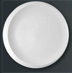
OCR-Nr. 10-4264-2990 Ø 370 mm, H = 30 mm Ø 14 ½ in., H = 1 ¼ in. Presentation tray · Plateau de présentation Präsentationsplatte · Bandeja presentación Vassoio di presentazione