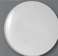
OCR-Nr. 10-4264-2601 Ø 290 mm, H = 24 mm Ø 11 ¼ in., H = 1 in. Flat plate · Assiette plate Speiseteller · Plato llano Piatto piano