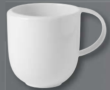
OCR-Nr. 10-4264-9651 125 x 90 x 95 mm · 0,40 l 5 x 3 ½ x 3 ¾ in. · 13 ½ ozs. Mug · Chope · Becher mit Henkel Jarra · Bicchiere con manico