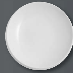
OCR-Nr. 10-4264-2700 Ø 290 mm, H = 48 mm · 1,70 l Ø 11 ½ in., H = 2 in. · 57 ½ ozs. Deep bowl · Coupe creuse · Schale tief Fuente honda · Ciotola fonda