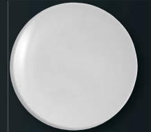
OCR-Nr. 10-4264-2640 Ø 240 mm, H = 21 mm 9 ½ in., H = 1 in. Salad plate · Assiette dessert Frühstücksteller · Plato postre Piatto dessert