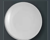
OCR-Nr. 10-4264-2660 Ø 160 mm, H = 19 mm Ø 6 ¼ in., H = ¾ in. Bread & Butter Plate · Assiette à pain Brotteller · Plato fruta / queso / pan Piatto pane