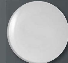
OCR-Nr. 10-4264-2620 Ø 270 mm, H = 24 mm Ø 10 ⅝ in., H = 1 in. Flat plate · Assiette plate Speiseteller · Plato llano Piatto piano